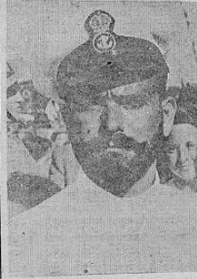
Oficial judío de la Escuela Náutica de Tel Aviv de Palestina

Los judíos característicos de esta orgullosa marina, son hombres de temple, de voluntad, hombres que afrontan las traiciones del mar y el furor de la naturaleza bravía con una absoluta serenidad de espíritu. Y si el ser comerciante es característica del judío