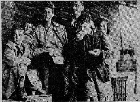
Al llegar al puerto de Haifa, procedentes de Dachau, las puertas de la libertad se abren ante los ojos de esta familia de judíos italianos de Florencia

Las noticias de la redención llegaron a las 3 de la tarde